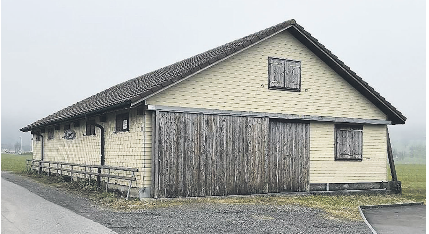
Ansicht des bestehenden Lagergebäudes.